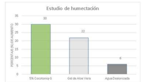
Figura 2- Comparativo de los niveles de humectación en la piel, posterior a la aplicación de Cocotoniq-G respecto a dos controles.

Los activos actualmente en el mercado, incorporan solamente algunos de los beneficios del coco, ya que algunos están contenidos solamente en el agua, o en el aceite, o en la carne. Esto es una gran oportunidad perdida. Cocotoniq-G retoma esta filosofía de extracción integral, volviéndose punta de lanza en una nueva generación de ingredientes sustentables, y de beneficios múltiples. Se realizó un estudio de humectación dérmica, con un Corneómetro Dermalab en 20 sujetos M/F durante 48 horas. Se realizaron mediciones al inicio y al final, y se concluyó que Cocotoniq-G es un excelente hidratante dérmico.